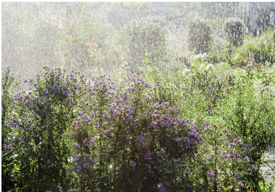
Automatische Bewässerungssysteme sparen Zeit und Wasser.

STÄNDIGE SOMMERHITZE UND IMMER WIEDER AUFTRETENDE TROCKEN-PERIODEN RÜCKEN AUTOMATISCHE BEWÄSSERUNGSSYSTEME IN DEN MITTEL-PUNKT. DAS BREITE ANGEBOT REICHT VON DER TROPFBEWÄSSERUNG FÜR KÜBELPFLANZEN BIS HIN ZUM VOLLAUTOMATISCHEN SMART GARDEN.